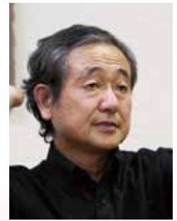
銀河浴写真家 佐々木隆